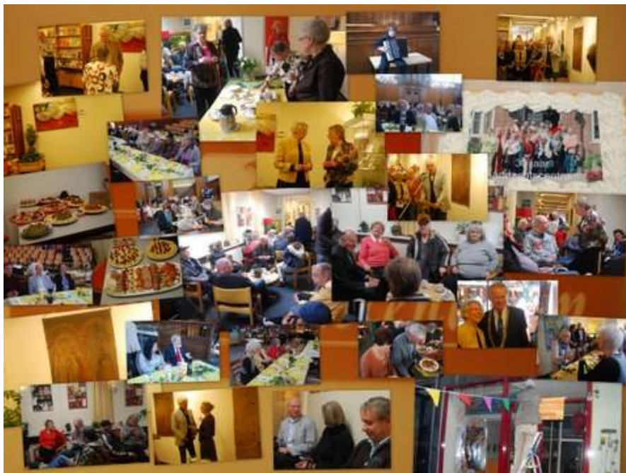
Collage lustrum van Eric Ebbink

Foto voorpagina: Kunstwerk Jim Beaudoin: '36 good old friends; some are still kicking, some have bit the dust and some have gone with the wind'