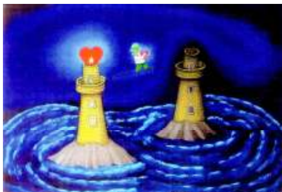
Slobodan, kunstschilder uit voormalig Joegoslavië

Nou, dat is een mondvol, maar is dat niet precies wat wij proberen te doen in het AC, bezoekers en medewerkers samen, al 30 jaar lang?!?